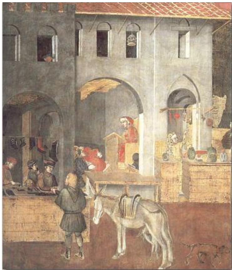
Giornate di studio sulla giustizia amministrativa

info@studiofrancario.eu tel. 0577-704604